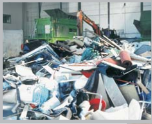
Grov- & industriavf.