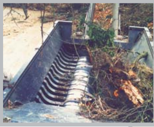
Park- & trädgårdsavf.