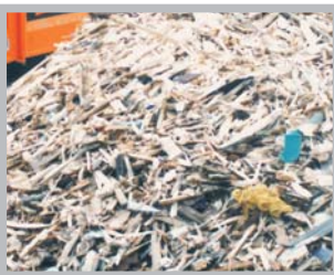
Virke, lastpallar Däck

Krossning av virke, stubbar, park- och trädgårdsavfall, biologiskt avfall, hushålls-, grov- och industriavfall, rivningsmassor, m. m.