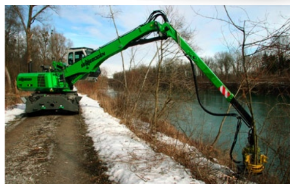
Röjning längs å-kant med god översikt och räckvidd.

För mer information kontakta OP system på tel 0418-44 62 70.