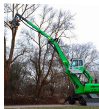
Svåröverträffad räckvidd på 14 meter.