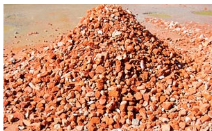
Efter: Tungt material, sten & betong