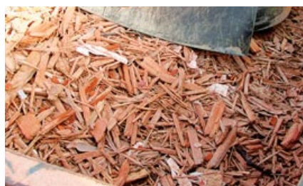
Efter: Lätt material, trä och brännbart