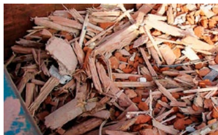
Före: Blandat rivningsmaterial

Vindsiktarna finns i ett antal storlekar med kapacitet upp till 250 t/h eller 200 m 3 /h beroende på material, med arbetsbredd på 800–2000 mm.